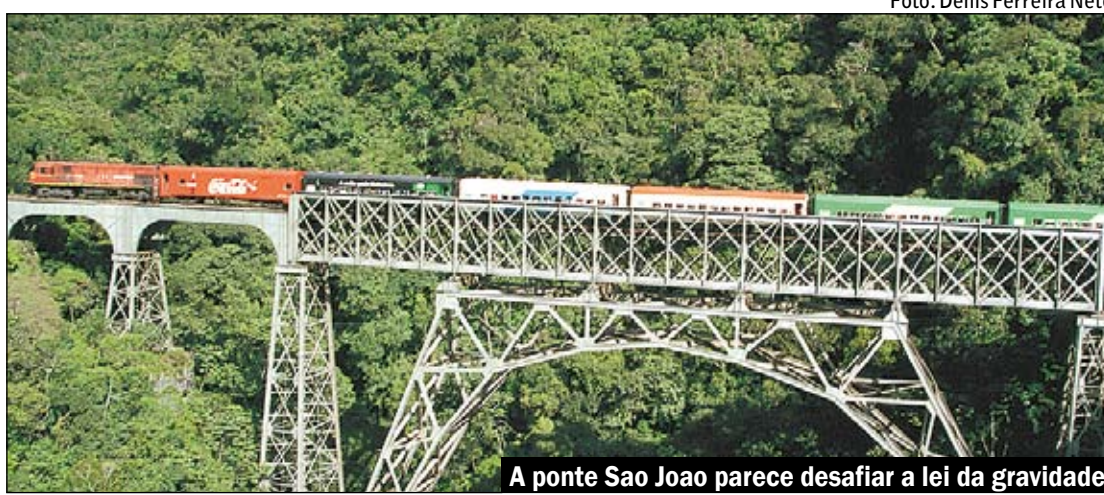
A ponte São João parece desafiar a lei da gravidade